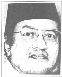
Datuk seri Dr. Mahathir Mohamad

rakyat kononnya wujud masalah antara kedua-dua pihak. Ini ditambah lagi dengan tindak-tanduk pembangkang yang kerana ketiadaan isu lain, menjadikan soal itu sebagai senjata utama mereka mengabui rakyat Kelantan.