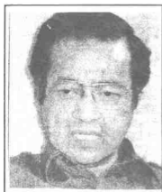
Dato' Sri Dr Mahathir

Ada perkara-perkara yang tidak mereka buat tetapi mereka buat. Ini perlu diperbetulkan.