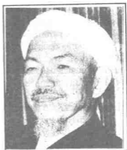
Tuan Guru Haji Nik Aziz

KOTA BHARU - Cadangan Menteri Besar Kelantan, Haji Nik Aziz Nik Mat yang mengesorkan supaya Raja-Raja Melayu membentuk kod etika perilaku menteri-menteri, ahli-ahli exco dan tokoh-tokoh politik telah mendapat perhatian dan sokongan rakyat.