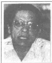
Lim Kit Siang

Maruah Raja-Raja perlulah dijaga walaupun usaha memperbaiki kesalahan Raja-Raja sedang dilakukan seperti kata pepatah Melayu "Menarik rambut dalam tepung".