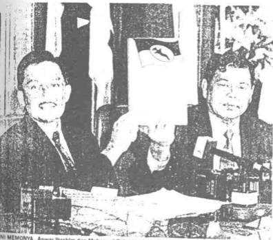
INI MEMONYA... Anwar Ibrahim dan Mohamed Rahmat memegang salinan memorandum MT Umno yang diserahkan kepada Raja-Raja Melayu, semalam.